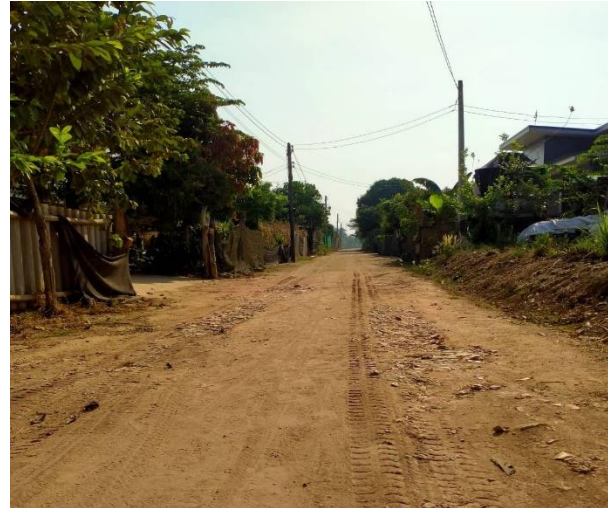
ซ่อมแซมไหล่ทางถนนข้างวัดชัยมงคล หมู่ที่ 7 บ้านดง